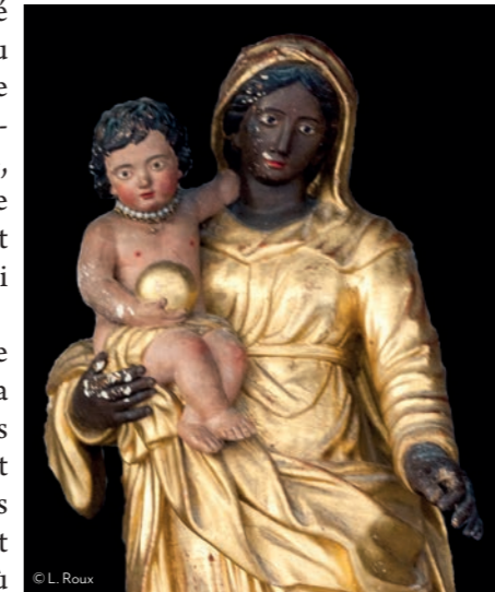
Anonyme, Vierge en polychrome en bois doré, seconde moitié du XIX ème siècle, actuellement déposée au château du Barroux

C'était la fête religieuse principale et les festivités, comme le bal ou le concours de belote avaient toujours lieu la veille, tandis que le jour du 15 août était préparé le plat traditionnel, le tian de tomates farcies que les villageois allaient cuire au four du boulanger. ■ Pascale Picard