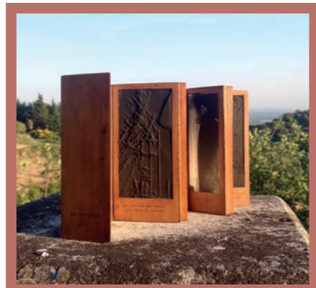
Livre réalisé avec l'atelier des Grames www.atelierdesgrames.com , gravures J.-C. Picard

L'équipe de « Grains de lire », a permis à tous, lors de ces 2 rencontres intergénérationnelles (de 6 à 80 ans...) de se découvrir, ou de révéler, des talents d'écrivains, poètes ou encore de dessinateurs.